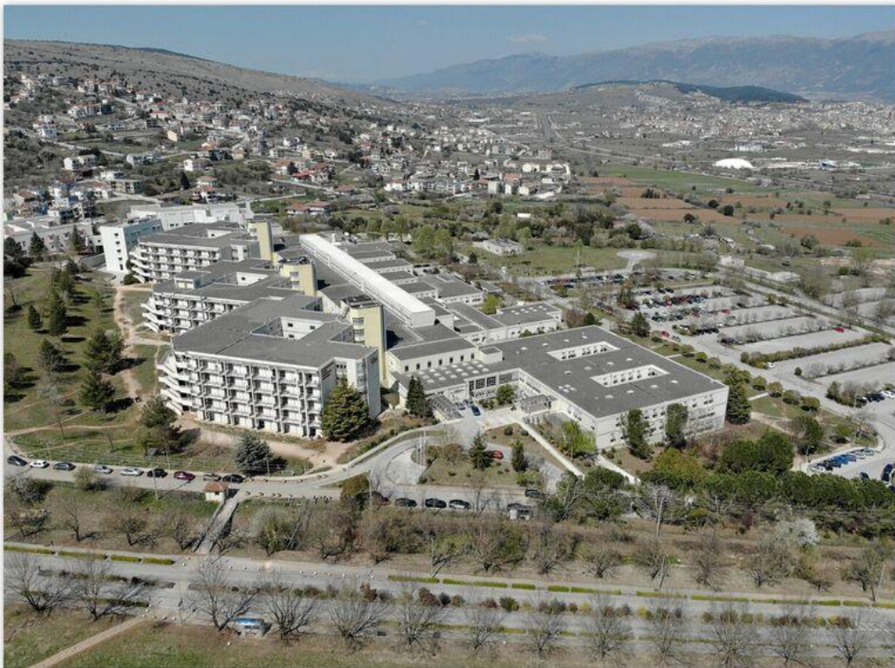
Κτηριακές Εγκαταστάσεις του Τμήματος Ιατρικής